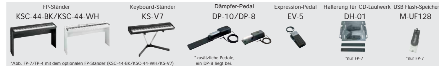
*Abb. FP-7/FP-4 mit dem optionalen FP-Ständer (KSC-44-BK/KSC-44-WH/KS-V7)